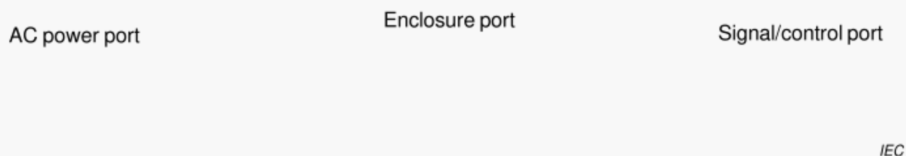
Figure 1 – Equipment ports

Note 1 to entry: Examples of ports of interest are shown in Figure 1. The enclosure port is the physical boundary of the equipment (e.g. enclosure). The enclosure port provides for radiated and electrostatic discharge (ESD) energy transfer, whereas the other ports provide for conducted energy transfer, either by direct injection or by induction.